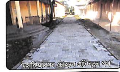
মহাবিদ্যালয়ৰ চৌহদৰ এটি নতুন পথ