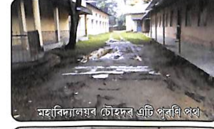
মহাবিদ্যালয়ৰ চৌহদৰ এটি পূৰ্বৰ পথ