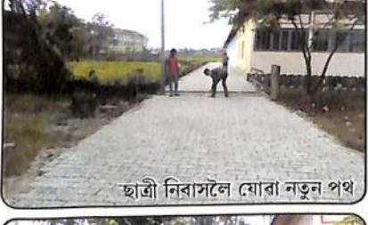
ছাত্ৰী নিৱাসলৈ যোৱা নতুন পথ