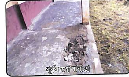
পূৰ্বৰ ভগ্ন বাৰাণ্ডা