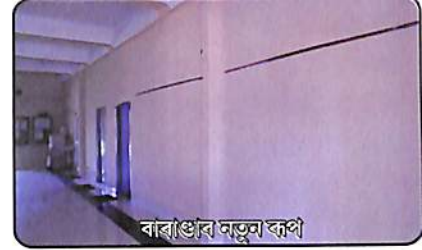
বাৰাণ্ডাৰ নতুন ৰূপ