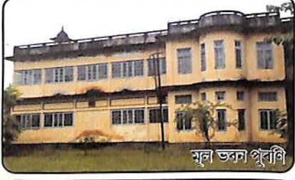
মূল ভৱন পুৰণি