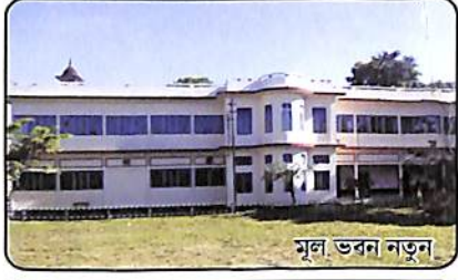
মূল ভৱন নতুন