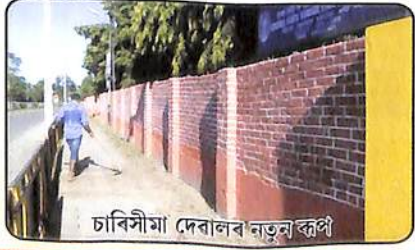
চাবিসীমা দেৱালৰ নতুন ৰূপ

এখন মহাবিদ্যালয় উন্নতিৰ দিশত আগবাঢ়িব পাৰে তেতিয়াহে যেতিয়া মহাবিদ্যালয়খনত কৰ্মসংস্কৃতি গঢ় লৈ উঠে। কানৈ মহাবিদ্যালয় এই ক্ষেত্ৰত এক সুস্থ পৰম্পৰা আছে। তথাপিও আৰু যেন যথেষ্ট কৰিবলগা আছে। কৰ্ম সংস্কৃতিৰ বাবে প্ৰয়োজন মানৱীয় সম্পৰ্ক। কাৰণ প্ৰতিজন ব্যক্তিয়ে ইজনে সিজনৰ প্ৰতি শ্ৰদ্ধাশীল হোৱাৰ প্ৰয়োজন আছে। নিজে আনক শ্ৰদ্ধা বা সন্মান কৰিব জানিলে তেওঁ আনৰ পৰা তেনে সন্মান লাভ কৰিব পাৰে। ঠেক গপ্তীৰ মাজত আৱদ্ধ হৈ থকা মানুহে কেতিয়াও আনক শ্ৰদ্ধা বা সন্মান কৰিব নাজানে। অৱশ্যে কানৈ মহাবিদ্যালয়ত এনে