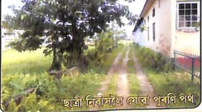
ছাত্ৰী নিৱাসলৈ যোৱা পুৰণি পথ