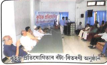
কুইজ প্ৰতিযোগিতাৰ বঁটা-বিতৰণী অনুষ্ঠান