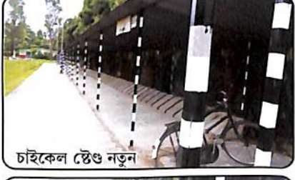
চাইকেল ষ্টেণ্ড নতুন