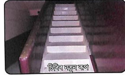
চিৰিব নতুন ৰূপ