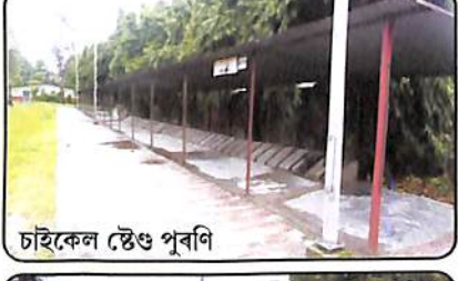
চাইকেল ষ্টেণ্ড পুৰণি