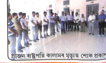
প্ৰাক্ষন বাস্তৱপতি কালামৰ মৃত্যুত শোক প্ৰকাশ