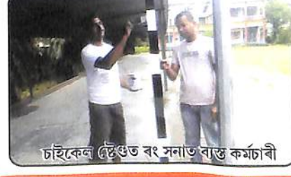
চাইকেল স্টেণ্ডত ৰং সনাত বাস্তৱ কৰ্মচাৰী